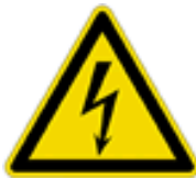
Gevaar voor elektrocute