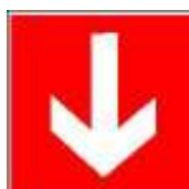
Te volgen richting