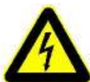
Gevaar voor elektrische spanning