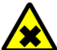
Schadelijke of irriterende stoffen