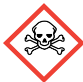
Giftig - toxisch