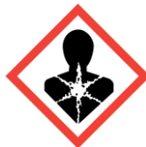
Lange termijn gezondheid schadelijk