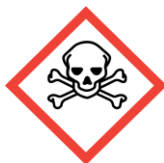
Giftig - toxisch