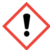
Irriterend - schadelijk